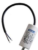
← Condensateur permanent cablé - dispo. de 12,5 à 50 µf ref. MKP__