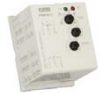
↑ CRM91H Relais tempo. pour armoire AD/CM1P